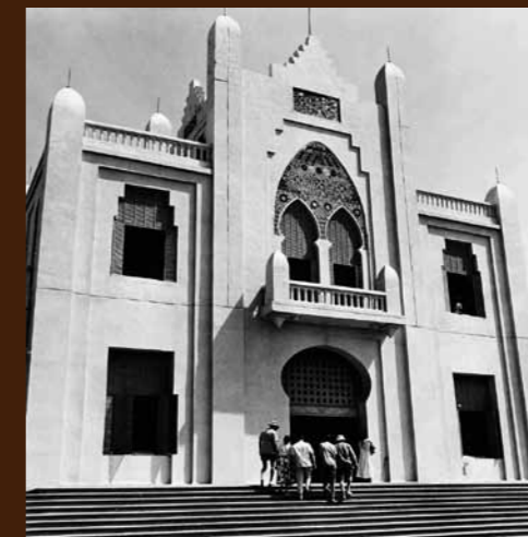
Palais du gouvernement à Niamey, Niger. Arch. nat., 20000335/41.