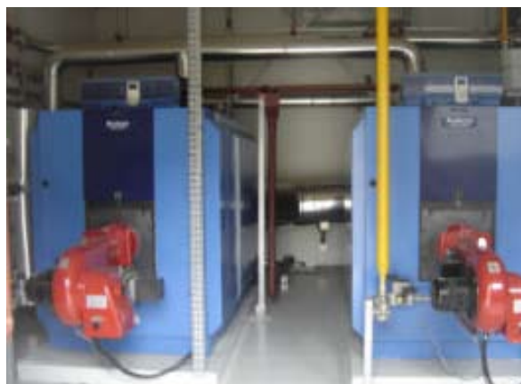
Équipement de co-génération Piscine de Villenave d'Ornon