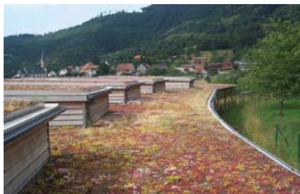
Toiture végétalisée Opération École maternelle de Tanenkirche - Photo CETE de l'Est