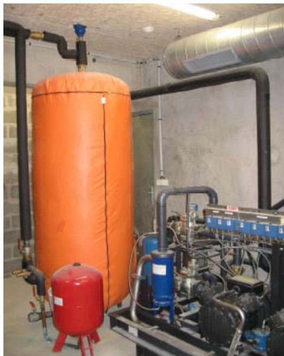
Système de récupération de chaleur sur le système de production du froid pour préchauffer l'eau chaude sanitaire Cuisine centrale de Saint-Étienne du Rouvray

Il en est de même d'une saine gestion des besoins en eau : plus de 2,4 milliards de m 3 d'eau sont consommés par an en France, dont seulement 38% pour un usage alimentaire et corporel ; il est donc essentiel de réduire au juste nécessaire les consommations d'eau potable, tout en gérant au mieux les eaux pluviales et usées et en limitant l'imperméabilisation des sols, qui augmente le risque de conséquences néfastes des pluies d'orage sur les réseaux d'assainissement, et donc de pollution.