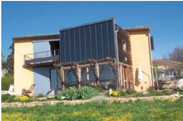
Orientation sud, serre bioclimatique et intégration de panneaux solaires, un exemple d'architecture bioclimatique passive de maison individuelle Maison DETOT KAVOUDJIAN

Les changements dans les modes de vie, comme dans les structures sociales, laissent prévoir dès aujourd'hui des évolutions profondes : par exemple, le développement du travail à domicile, ou le nombre grandissant de familles recomposées entraînent l'apparition de nouveaux besoins, dont il est difficile de prévoir à ce jour toutes les manifestations. De la même façon les équipements sont confrontés à un certain nombre de changements dans les usages. Qu'y a-t-il en effet de commun entre la bibliothèque d'hier et la médiathèque d'aujourd'hui ?