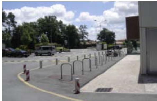
Implantation des stationnement vélo à proximité de l'entrée piéton de l'équipement Piscine de Villenave d'Ornon