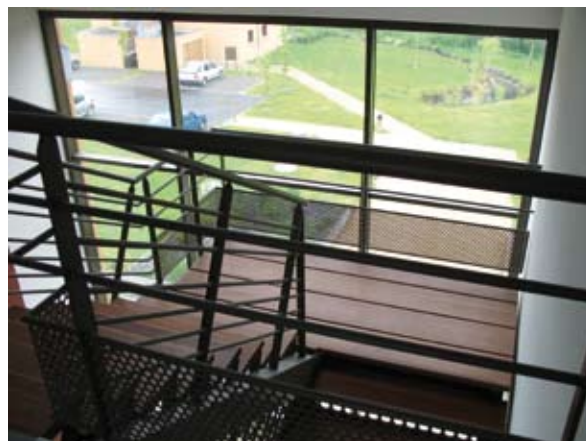
Privilégier la lumière naturelle dans les parties communes Opération de logements collectifs à Mordelles

Si elle peut être cernée avec une certaine clarté, la notion de qualité d'usage n'en demeure pas moins source de questionnements et d'enjeux. Le premier d'entre eux est celui de la durabilité de cette qualité. En effet, au-delà de la pérennité du niveau objectif de qualité d'une construction, se pose le problème de la stabilité dans le temps des attentes de ses occupants.