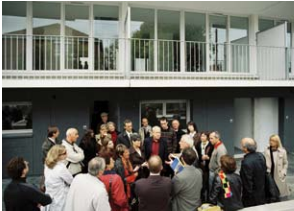
Le rôle et la prise de décision des parties prenantes : un élément essentiel de la gouvernance