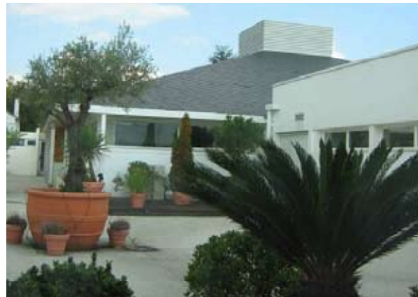
Le soin apporté aux espaces extérieurs, comme l'aménagement végétal, permet de développer un sentiment de confort et d'apaisement - Centre de Dialyse Aressy

De même, on ne peut négliger la dimension de la représentation dans la qualité d'usage : l'image que l'occupant se fait de son logement ou l'usager de son équipement peut l'amener à récuser a priori des choix dont les qualités environnementales sont reconnues. La qualité d'usage est une composante essentielle du développement durable, mais les comportements individuels n'en sont pas pour autant forcément cohérents avec l'intérêt écologique. Elle se fonde donc sur des compromis ; en contrepartie, elle est aussi un élément fort de stimulation de l'innovation architecturale et technique.