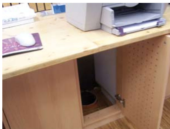
Sortie du puits canadien Opération Pôle éducatif de Thannenkirch