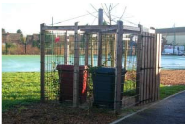
Intégration des poubelles de tri sélectif dans l'espace public extérieur Groupe scolaire Jean MINEUR

l'effet produit sur le paysage. Le choix des produits, des systèmes et des procédés employés est également lourd de conséquences : il s'agit d'assurer la qualité technique et la performance de l'ouvrage, mais aussi sa durabilité et son adaptabilité, en privilégiant des produits à faible impact environnemental, et en favorisant la facilité d'entretien et de maintenance. Cette volonté doit par ailleurs presque toujours composer avec la contrainte financière, qui oblige souvent à des compromis.