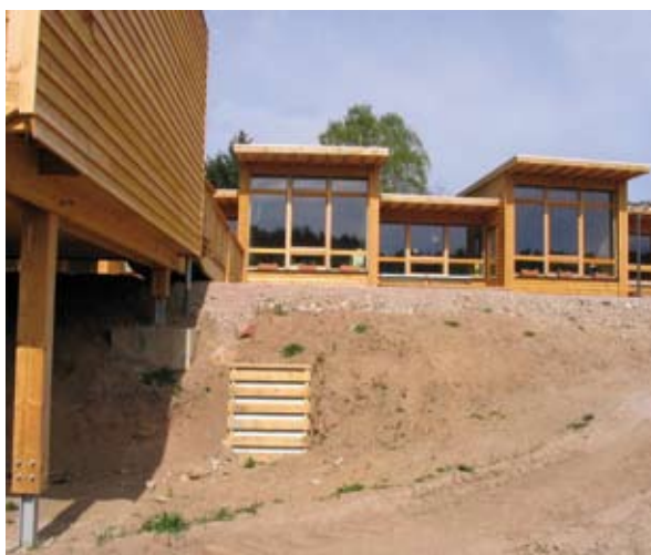
Entrée du puits canadien Opération Pôle éducatif de Thannenkirch