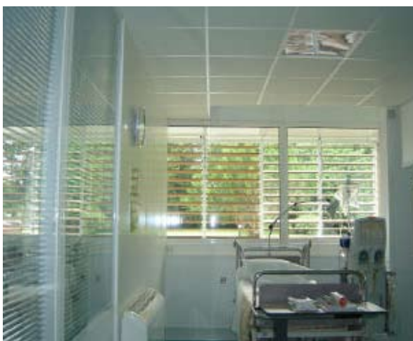
Protections solaires qui permettent de se protéger de l'éblouissement et des surchauffes tout en laissant pénétrer la lumière naturelle et en préservant confort et confidentialité Centre de Dialyse Aressy

Par ailleurs, si le temps est une des contraintes qui pèsent sur la qualité d'usage, il est patent que la variable économique, l'espace disponible dans l'absolu, et, dans une optique de développement durable, la nécessité de ne pas compromettre la capacité des générations futures à répondre à leurs propres besoins, sont autant de limitations qui obligent à des arbitrages : ainsi disposer d'un logement qui s'approche des qualités de l'habitat individuel doit composer avec la nécessité de faciliter les dessertes, avec la densité du bâti, et avec les attentes collectives.