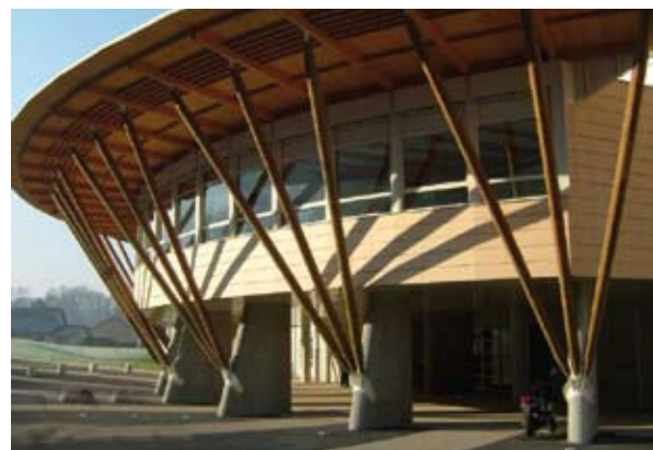
Intégration du bois dans la construction Lycée Marie REYNOARD

L'existence d'outils de référence représente un pas important ; pour autant, les problématiques demeurent fortes. La première concerne le choix du site. Les enjeux sont multiples : limiter les impacts du bâtiment sur l'environnement (air, eau, sols, faune et flore), et respecter l'équilibre écologique, en prenant en compte des interactions fortes telles que l'écoulement des eaux pluviales, mais aussi