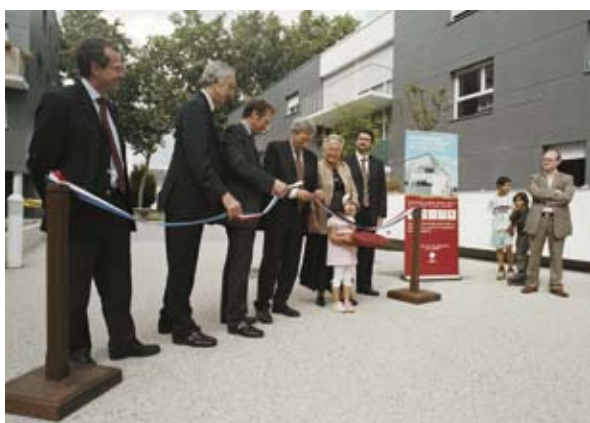
La concertation et les partenariats : une pratique professionnelle à généraliser

La gouvernance est une nécessité : elle permet de mettre en place des retours d'expérience qui servent à progresser, et qui interdisent tout retour en arrière, toute régression. C'est un état d'esprit, qui n'est d'ailleurs pas propre au bâtiment : la gouvernance regroupe des principes de management de projet, de démarche qualité tels qu'on peut les pratiquer dans d'autre secteur économique. C'est une question de culture et de partage. »