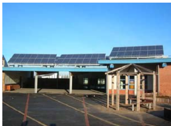
Panneaux solaires photovoltaïque Groupe scolaire Jean Mineur

Ces bâtiments (logements, équipements, tertiaire) sont en service depuis au moins un an afin d'apprécier leurs performances réelles en exploitation et vis-à-vis de l'usage. Les réalisations doivent en effet être choisies autant sur leurs performances que sur la cohérence et la maîtrise des ambitions de durabilité depuis le programme jusqu'à la vie en oeuvre de l'opération.