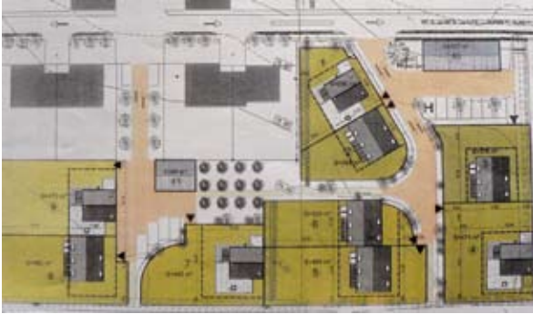
L'absence d'alignement permet de différencier les différentes maisons malgré une densité forte (moins de 350m 2 de jardins par maison) Opération de Langouët