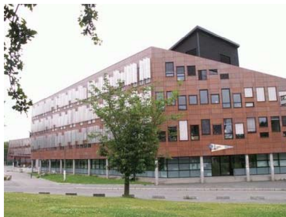
L'inscription architecturale peut aussi vouloir signifier créer un signal fort et reconnaissable dans son environnement Université des Sciences et Technologies de Lille (USTL)

La qualité urbaine assure à tout projet un impact positif, sur les plans individuel autant que collectif. Elle est d'autant plus importante, et délicate à garantir, qu'elle joue sur trois niveaux, eux-mêmes interdépendants : le bâtiment lui-même, le quartier, et le territoire.