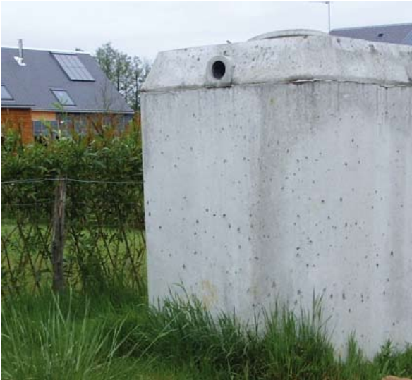
Récupérateur d'eau Opération de Langouët

Enfin, en ce qui concerne les déchets ménagers, si leur production n'est pas imputable à la construction par elle-même, une étude attentive peut en faciliter le tri comme l'évacuation, et ainsi réduire leur impact environnemental. Il faut cependant garder à l'esprit que la qualité environnementale d'un bâtiment doit s'inscrire dans la durée, et qu'en conséquence la conception doit intégrer cette nécessité, en termes de moyens de suivi, de facilité d'accès, et de gestion des risques.