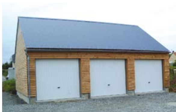
Le regroupement des garages permet de privilégier le déplacement piéton vers les habitations Opération de Langouët

La qualité urbaine assure à tout projet un impact positif, sur les plans individuel autant que collectif. Elle est d'autant plus importante, et délicate à garantir, qu'elle joue sur trois niveaux, eux-mêmes interdépendants : le bâtiment lui-même, le quartier, et le territoire.